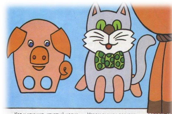
Кот и хрюшка, круглый носик. Утром вышли погулять,

Ребёнок вы не только соприкоснется с театральным мастерством, но и испытаете радость творчества